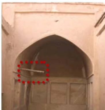
تصویر ۳- آثار کارگاه برک در ایوان خانه‌های کوچک