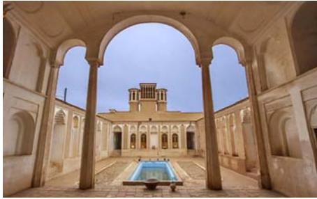
تصویر ۶- خانه مستوفی، دید از ایوان جنوبی به حیاط