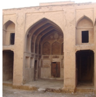
تصویر ۵- خانه شیرزاد؛ یکی از خانه‌های بزرگ پیمون صفوی. بروار و گوشوار در کنار ایوان‌ها نمایان می‌شوند.