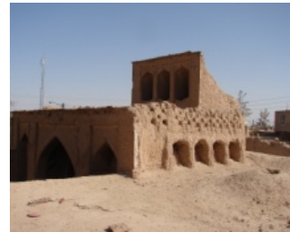
تصویر ۴- پیشان برجسته دو ایوانی‌های اشرافی در پشت بام

فصل زمستان فراهم می‌کرده است و علاوه بر آن، در فصل تابستان هم آفتاب از این ناحیه رخت بر می‌بسته و محیط دلپذیر و خنکی را به ویژه در ابتدای صبح در اختیار اهل کار قرار می‌داده است. به نظر می‌رسد فعالیت مداوم برک‌بافی در فصولی که کار کشاورزی نبوده است، در این فضاها صورت می‌پذیرفته است. و با توجه به سرانه ساکن در شهر تاریخی در دوران حیات خود، تولیداتی که از این خانه‌ها بیرون می‌آمده حجم و وزن قابل توجهی را به خود اختصاص می‌داده است.