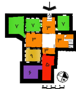
نقشه ۱- خانه پیرزن