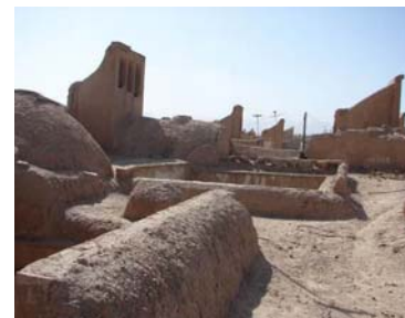
تصویر ۱- بافت چهارصفه‌ها از پشت بام