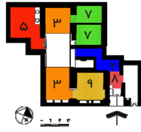
نقشه ۲- خانه تقی‌زاده