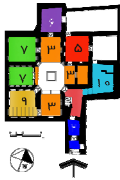
نقشه ۳- خانه ملا عبدالله