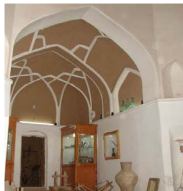
تصویر ۲- نمایی از ایوان زمستانی در خانه ملاعبدالله