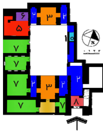
نقشه ۵- خانه شیرزاد؛ یکی از خانه‌های بزرگ پیمون صفوی