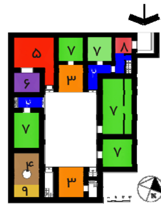
نقشه ۴- خانه پناهی؛ یکی از خانه‌های بزرگ پیمون سبک صفوی