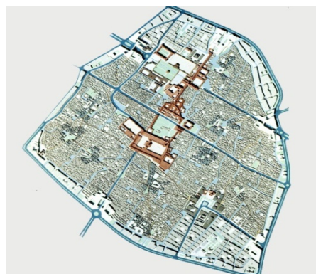
تصویر ۲- بافت تاریخی شیراز منبع گزارش مشاور پردازاز ۱۳۹۱

صورت یافته از یک طرف و سرریز جمعیت جویای کار، فرسوده شدن بافت، مهاجرت افراد اصیل منطقه به بیرون در کنار مسائل متعددی که در مجموع باعث کاهش ارزش سکونتی این منطقه بوده باعث شده تا در مقایسه با سایر مناطق شهر شاهد سکونتی بسیار ناپایدار با کیفیت پایین و بافت اجتماعی ناهمگون و نامنسجم در آن باشیم (تصویر ۲). افراد مهاجر جویای کار و تهی دستان شهری در این سالها جذب منطقه شده اند و ناامنی و فقر و برهم خوردن نظام قشربندی اجتماعی و کاهش گرایش به سکونت اقشار بالا و میانی در آن به چشم می خورد (جدول ۲).