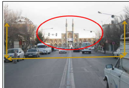
تصویر (۴): محصوریت، وجود عناصر منحصر به فرد در خیابان قیام شهر یزد