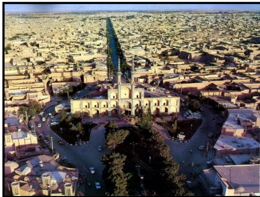
تصویر (۷): ایجاد خوانایی در خیابان با بهره‌گیری از نشانه شهری میدان امیرچخماق

• هویت و ویژگی‌های فرهنگی خاص هر شهر، حفظ و ارزش‌های مثبت فرهنگ محلی و تمایز و تشخیص خیابان نسبت به سایر شهرها و حتی در خود شهر تقویت شود. (لقایی، محمدزاده، ۱۳۷۸، ص ۳۹) • حس مکان از طریق ایجاد تناسب و تطابق میان ساختار فضایی، عنصر زمان، معنا، ارتباطات و فرهنگ اجتماعی که با توجه به رویکرد تقلید شکلی از سکونتگاه‌های سنتی برای دستیابی به مکان با هویت باید قابلیت‌های واقعی و ویژگی‌های انفرادی هر محل به صورت خاص شناسایی و جایگزین شود. (هاتون و پانکر، ۱۹۹۶)