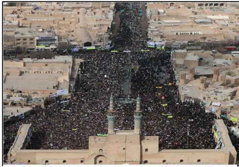
تصویر (۶): انعطاف‌پذیری و امکان فعالیت‌های گوناگون

انعطاف‌پذیری ، حضور همه گروه‌های اجتماعی در یک خیابان، با امکان فعالیت‌های گوناگون در آن تحقق پیدا خواهد کرد و خیابان باید انعطاف کافی برای تغییر را داشته باشد که از مشخصه‌های توسعه پایدار بوم‌گراست.