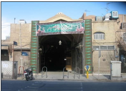
تصویر (۵): برگزاری مراسم مذهبی در بازارهای سنتی - بازارخان خیابان قیام شهر یزد

تناسبات بصری ، آن بخش از خیابان‌ها که واجد تناسبات بصری مطلوبی هستند و به عبارتی در آن اغتشاش بصری کمتری وجود دارد، نسبت به سایر فضاها احتمالاً کمتر با تنش روانی در استفاده‌کنندگان از آن عجين می‌شوند که یکپارچگی بدنه خیابان،