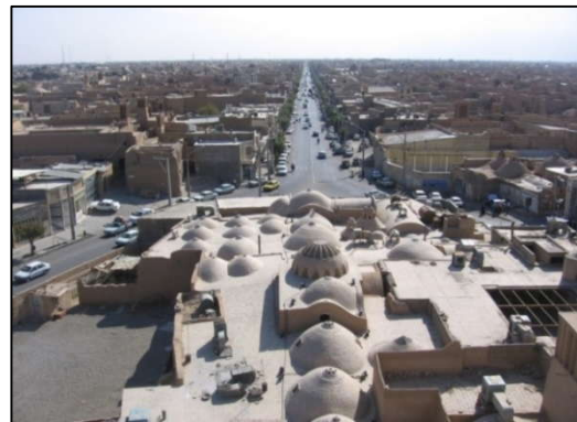
تصویر (۳): طراحی متناسب با اقلیم (استفاده از طاق‌های گنبدی شکل و مصالح بومی) - خیابان سلمان شهر یزد

عناصر سخت، نرم و مقیاس عناصر و سطوح، نقش زیادی در پایداری و پایایی فضای معابر شهری دارد (امین‌زاده، ۱۳۸۱، ص ۵۷).