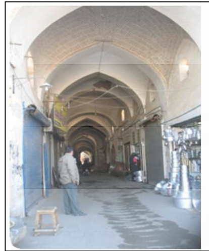
تصویر(۸): استقرار بازار مسگرها در جداره خیابان قیام و ایجاد

بالتوجه استعداد بیشتری در ایجاد این‌همانی با انسان دارد و انسان آن فضا را متعلق به خود دانسته و به مرور آن را به خاطره‌ای در ذهنش مبدل می‌سازد. غنای حسی می‌تواند ناشی از ریتم و الگو، رنگ، نور و روشنایی، پوشش گیاهی، آب و غیره باشد. ۱۶