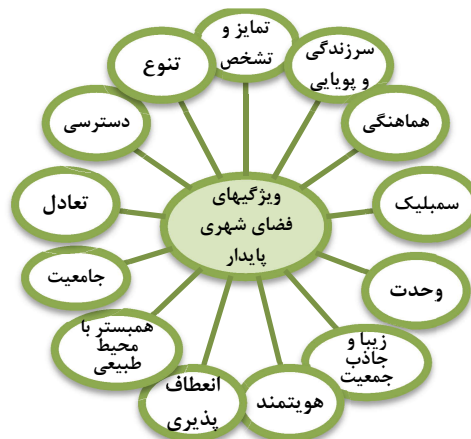
نمودار(۳): ویژگی‌های فضای شهری پایدار با رویکرد بوم‌گرا

نمودار شماره (۳)، ویژگی‌های فضای شهری پایدار را با توجه به معیارهای فوق به نمایش می‌گذارد: