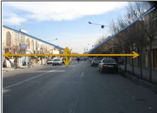
تصویر (۲): وجود هماهنگی، تعادل و وحدت در خیابان قیام شهر یزد

میزان استفاده و نیز ایجاد تعادل نحوه ترکیب حرکات پیاده و سواره می‌باشد. (امین‌زاده، ۱۳۸۱، ص ۵۷)